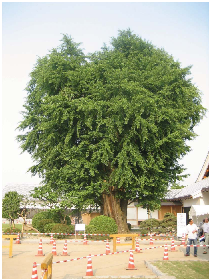
熊本城大広間前の大銀杏