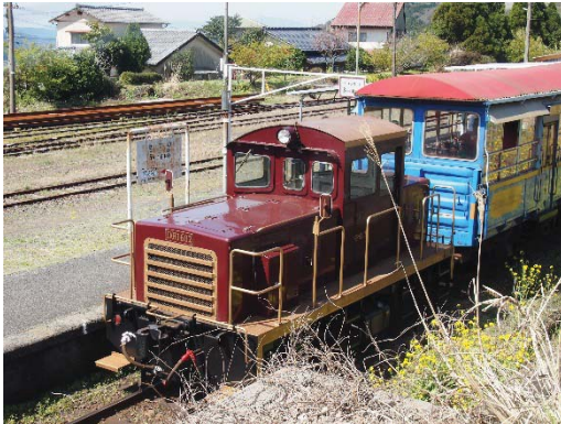
南阿蘇鉄道のトロッコ列車