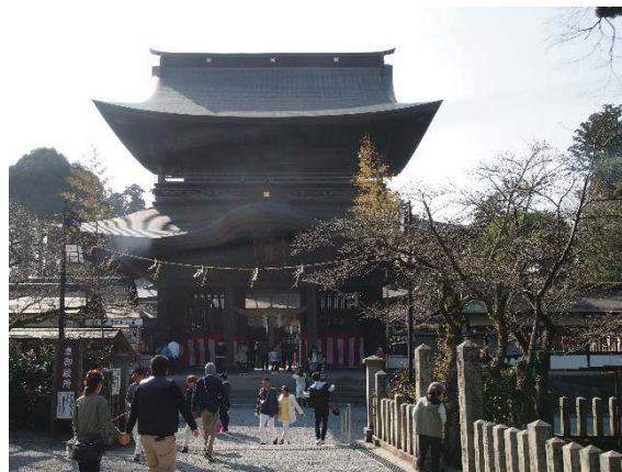
崩れ落ちた阿蘇神社