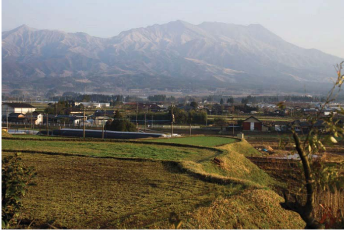
ロッジから見える根子岳